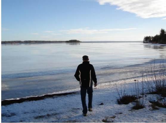
Oneindig veel ijs.

Na het ontbijt zouden we naar Sàlen rijden om daar de startbescheiden op te halen. We zijn via een toeristische route gereden en onderweg zagen we overal grote ijsvlaktes, heel veel ijs maar absoluut geen schaatsers.