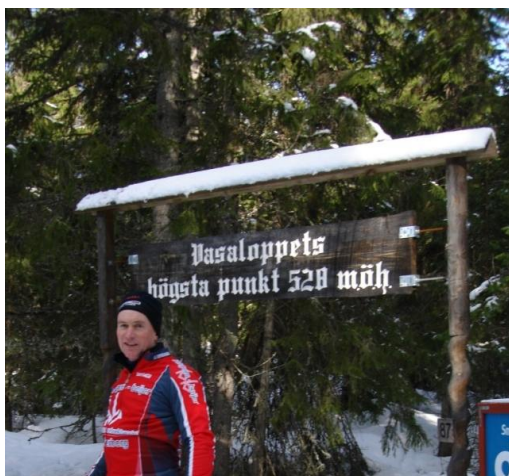
Hoogste punt Vasaloppet

Aan de andere kant van de start zou de zwaarste klim van de Vasaloppet zijn, inderdaad, de beelden die we op TV zagen leken vlak, niets is minder waar een klim van 2 km 15 % Gewoon heel rustig omhoog in de visgraat. Vond zelf dat de ski's niet zoveel grip hadden, René vond het prima.