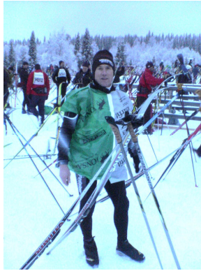
Lekker warm 2 plastic zakken

Zo'n 15.000 mensen zien springen geeft apart gevoel. Wij deden in onze "speciale outfit", flink mee.