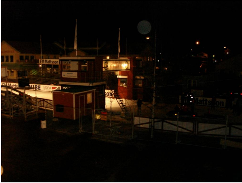
Finish Omgeving Mora

Eindelijk komen de laatste km's in zicht en begint het aftellen, het euforisch gevoel van de laatste km's was echter ver te zoeken, deed een beetje denken aan de laatste rondjes Weissensee, maar dan 10x meer kapot.